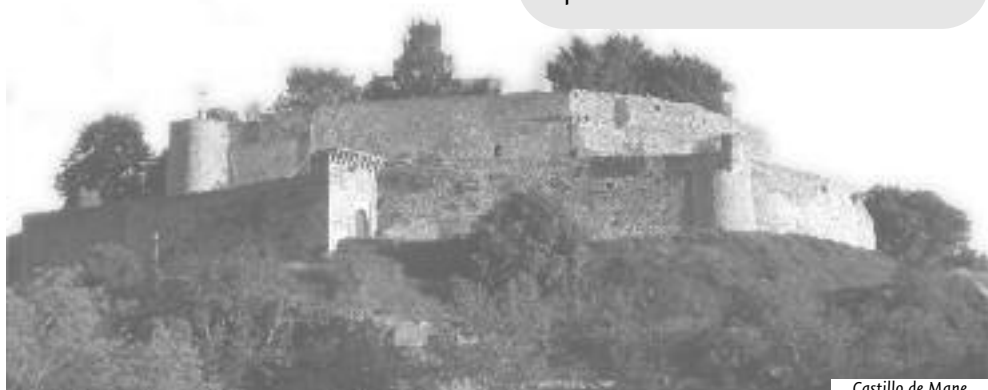
Castillo de Mane